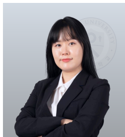
이나운 파트너 변호사

前 인천테크노파크 준법지원실장 前 삼약식품 상임감사 前 인천광역시 법률고문